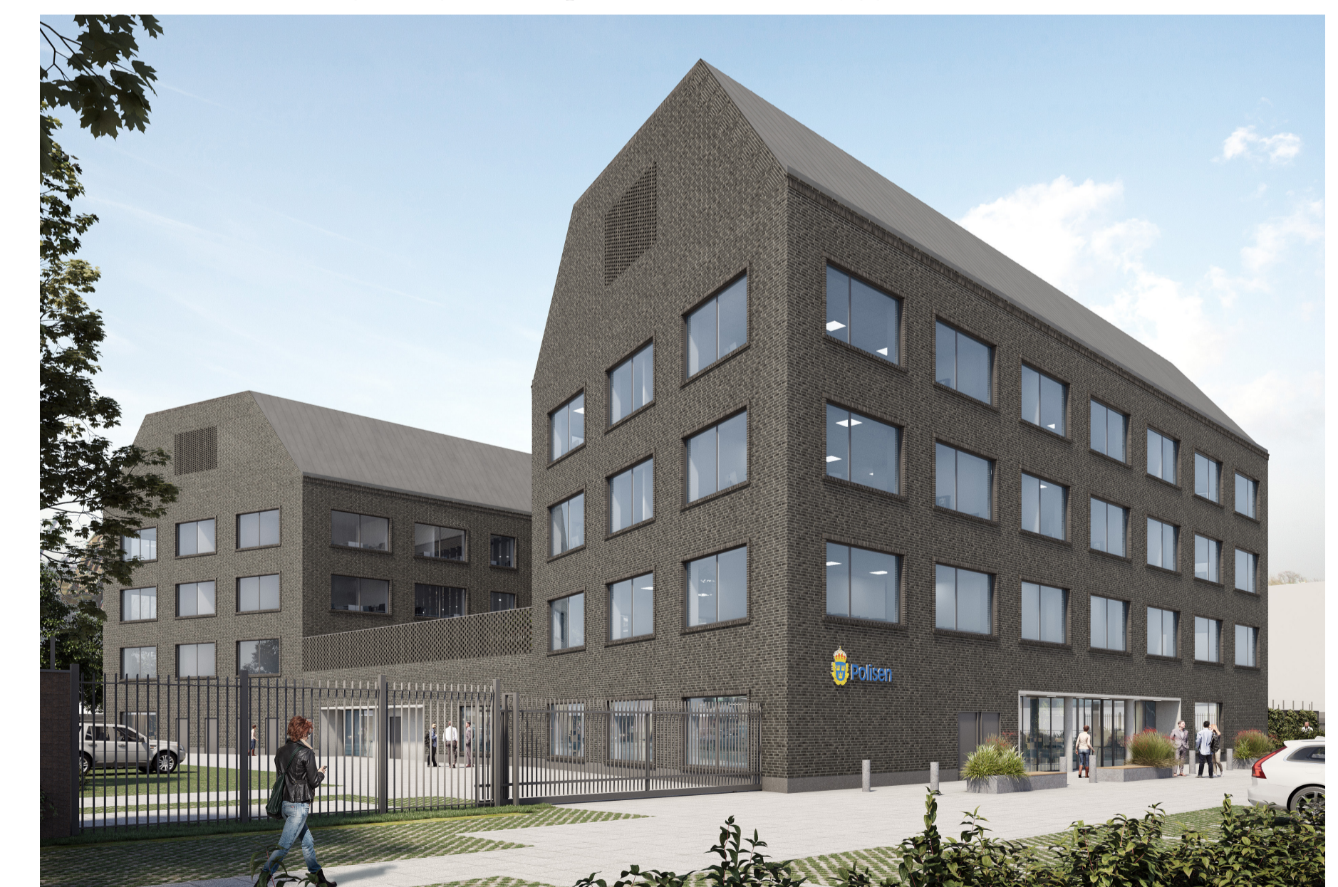
Gatvy över föreslagen byggnad från Exportgatan i sydost (Arkitektbyrån Design)