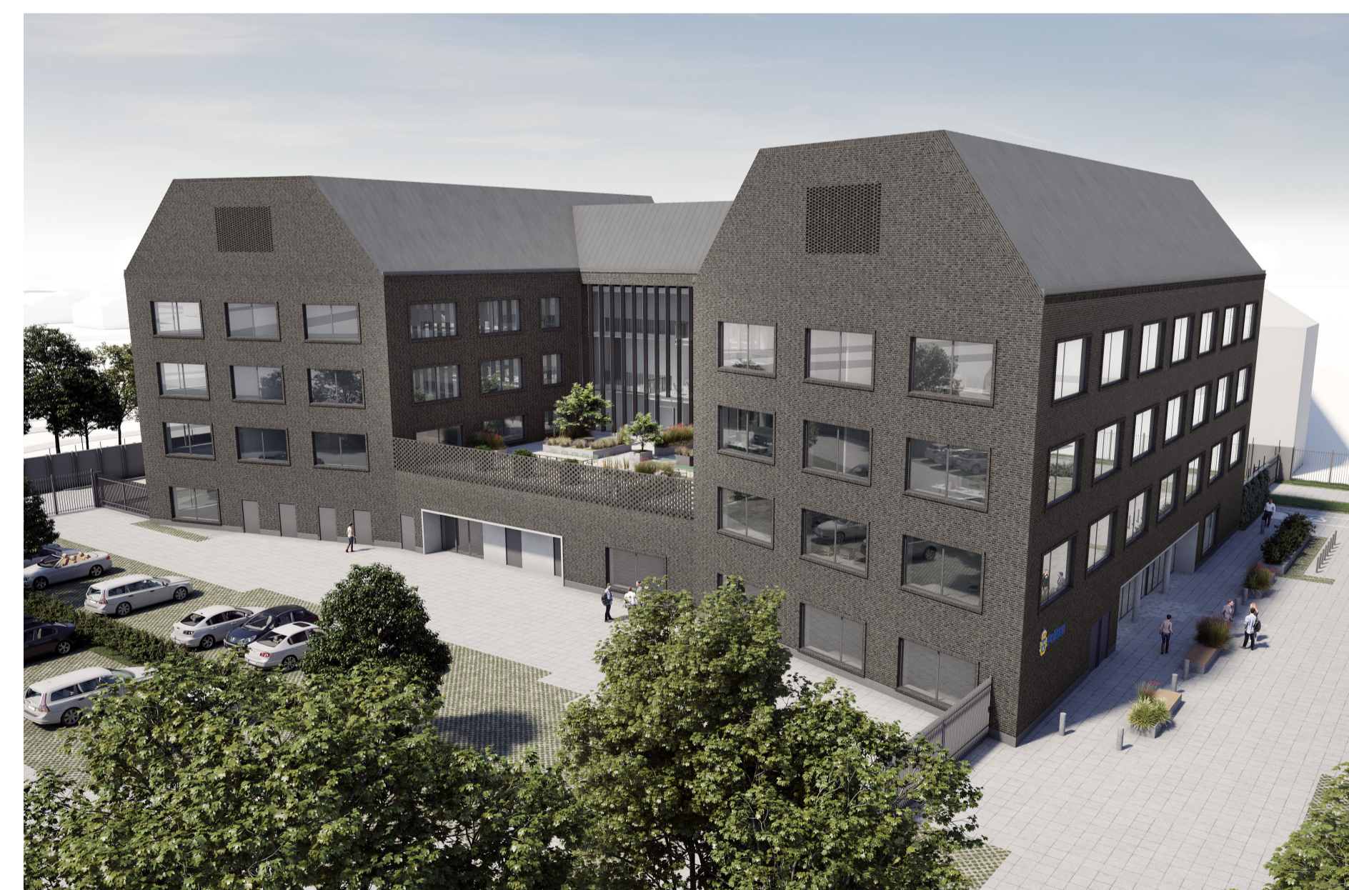
Föreslagen byggnad sedd från sydost (Arkitektbyrån Design)

Samrådet är ett skede där du som medborgare kan tycka till om förslaget. När samrådtiden är slut bearbetas dina synpunkter och ett färdigt detaljplaneförslag tas fram och ställs ut för granskning. Du måste lämna skriftliga synpunkter senast i granskningskedet annars kan du förlora rätten att överklaga beslut att anta detaljplanen.